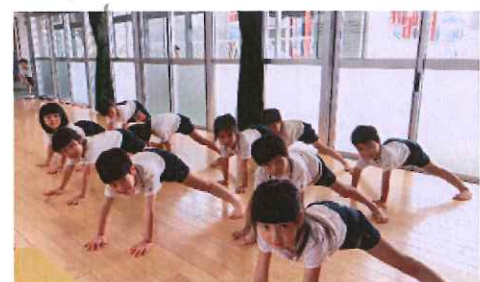
👂跳び箱を跳ぶときの姿勢を確認