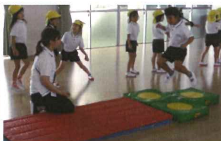
👂走る→タイミングよく踏切る→開脚