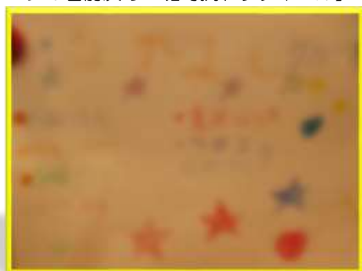
*ともだち グループ*